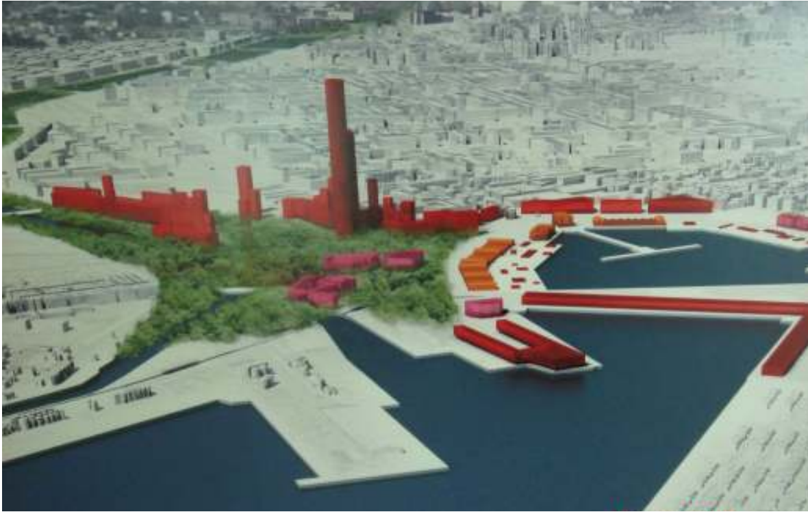
(5,6,7 y 8) Ilustraciones de algunos de los proyectos presentados al concurso internacional "Marina Real J. Carlos I". La 6 y 7 corresponden a J. Nouvel y von Gerhkan, ganadores ex-aequo